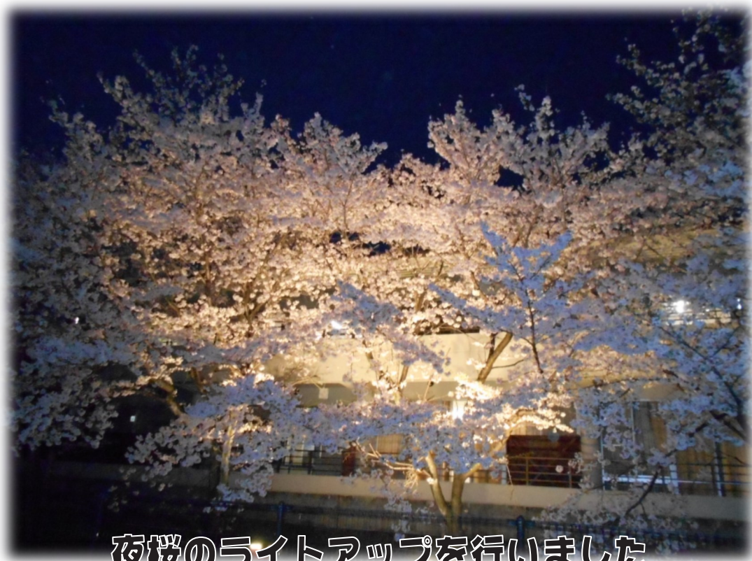
夜桜のライトアップを行いました